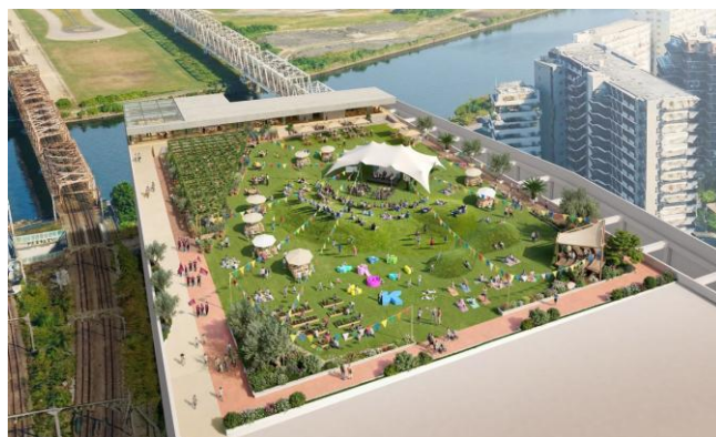
▲ルーフトップパーク開発 イメージビジュアル

具体的には、アリーナの屋上「ルーフトップパーク」のエリアネーミングライツを取得し、「ルーフトップパーク」を起点としたアリーナシティ全体で、食とヘルスケアを中心とする「アミノサイエンス®」による Well-being 創出の場を提供します。生活者や国内外からの来街者が幸せを実感できるまちづくりを目指すとともに、バスケットボールやダンスなどのコンテンツを活用した新たな取り組みも展開していく予定です。