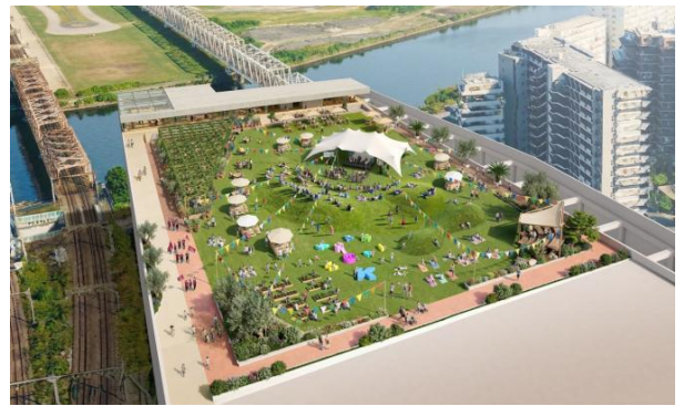
▲ルーフトップパーク開発 イメージビジュアル