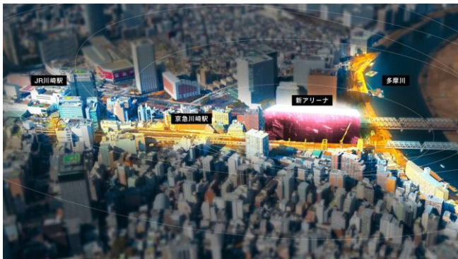
▲アリーナシティ開発 イメージビジュアル