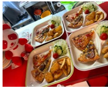
ライブでの物販ブースと子ども食堂のメニュー