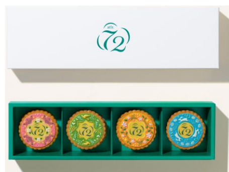
Atlr.72™ Flowering Mooncakes (Gift Box)

シンガポールには、9月17日の「中秋節」に美しい月を愛でながら家族の幸せを願って月餅を贈り合う風習があります。大切な人を想うとき、相手のことだけでなく、地球環境にまで心を配った贈り物は人と人との温かなつながりを作り出します。「Atlr.72™ Flowering Mooncake」は、クッキーサンド形状の月餅で、秋の旬をイメージした4種のフレーバー(柚子、京都宇治抹茶、ラズベリー、ブラックカラント)のギモーヴ※4を、プラナカン※5柄の華やかなデコレーションクッキーでサンドしています。クッキーの味わいにコクを付与するためにバターの一部を「Solein®」で代用、ギモーヴには動物性ゼラチンではなく寒天を使用、白砂糖は最小限に抑えてミネラルやオリゴ糖を含むてんさい糖を使い、素材の甘みが引き立つよう沖縄産海塩をわずかに加えるなど、日本の有名パティシエによるレシピ監修のもと、おいしさだけでなく、健康や地球環境にも配慮した工夫がなされています。