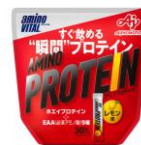
「アミノバイタル® アミノプロテイン」 レモン味