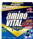
「アミノバイタル® プロ」