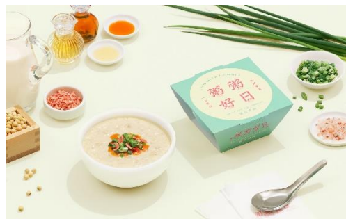
「粥粥好日」<鹹豆漿粥>

中華圏では一般的な、辛さが特徴の火鍋をお粥に。食欲をそそる一杯です。カロリーは236kcal[別添込]です。