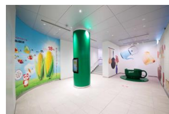
&lt;スープ見学コース(一部)&gt;

味の素グループは、“Eat Well, Live Well.”の実現に向け、今後も生活者に安心して召し上がっていただける製品を安定的にお届けできるよう、バリューチェーンの強化を図り、生活者の「食」と「健康」に貢献し続けます。