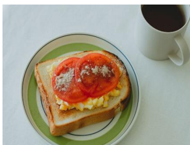
トマトと卵のトースト