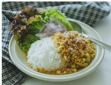
時短 スパイスカレー