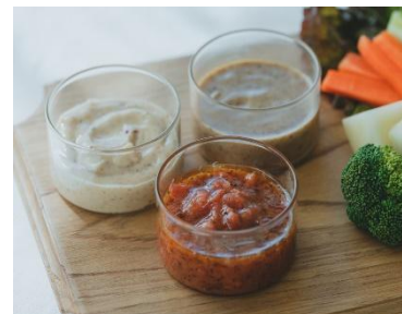
野菜のディップソースにも